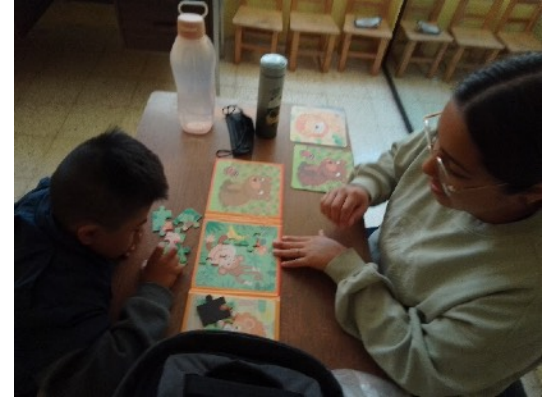
Terapia de lenguaje