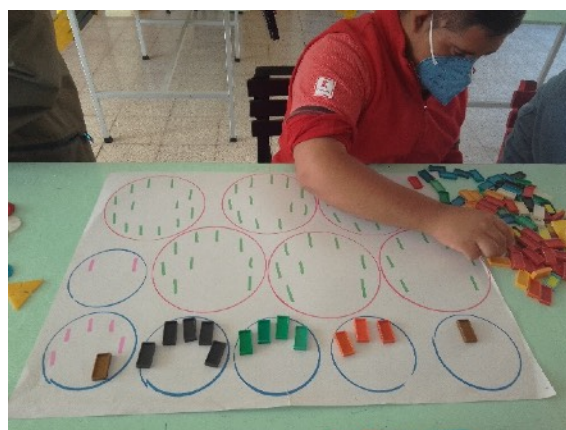
Alumnos trabajando la selección, clasificación y conteo. Previo a pasar al papel y lápiz